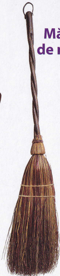
Mătură de nuiele