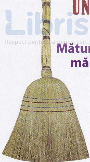
Mătură de mălai